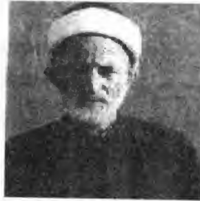
مهلا عه بدولکه ریمی موده پرپریس

به ریز مامؤستا مهلا عه بدولکه ریمی موده پرپریس له باره ی ئه و بلیمه ته پایه به زه دا ئاوا ده فه رموی له په رتووکی (علماءنا فی خدمة العلم و الدین) لاپه ره ی ٥٣٤ که مه به سه ته که ی وی به زمانی عه ره بییه و له وه پيشيش هیندیک له ده قی ویزامه (عبارت) ه عه ره بییه که مان هیناوه و وه ریشمان گپراوه ته سه ر زمانی کورد. ئه و به ریزه له بریزایی و تاره کهیدا ئاوا ده فه رموی: